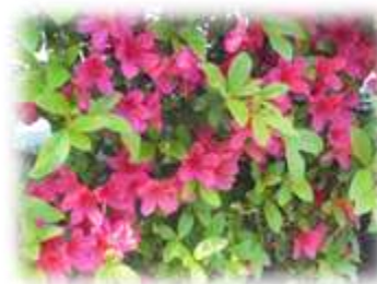
ツツジが華やかです