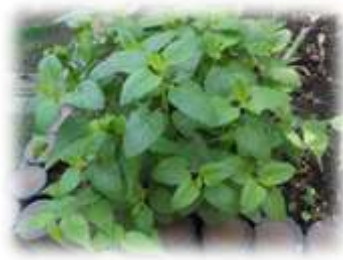
レモンバームはいい香り。どこにあるでしょう？