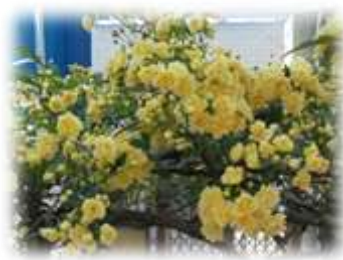
フェンスのバラが満開です