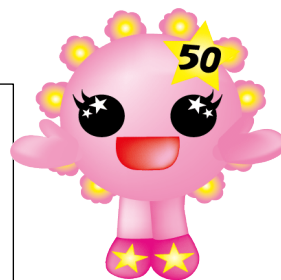
三光幼稚園 50周年記念 マスコットキャラクター きらりちゃん