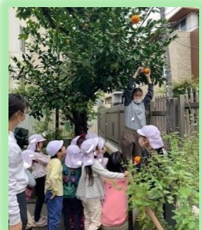
園庭になったみかん採りの様子

幼児期に最も重要なことは、健康な心と体づくりです。まずは「早起き」から始め、朝の起床時に日光を浴びて体内リズムをリセットしましょう。冬休みの年末やお正月は、ご家庭で家族団らんをしながら楽しく過ごされることと思いますが、できる限り、園生活で培った生活のペースを崩さず、夜更かしや朝寝坊を避け、健康で安全で楽しい冬休みをお過ごしください。