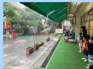
突然の大雨に 驚く子どもたち