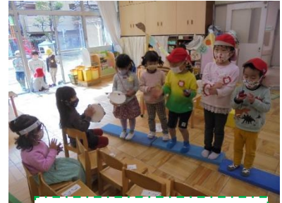
コンサートが始まるよ！