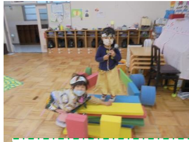
私たちはプリンセス！