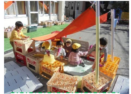
おうちを作ったよ