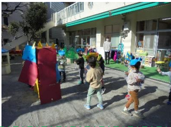
「おにはそと ふくはうち！」

電車やプリンセスになりきったり、園庭にあるケースやマットを組み合わせておうちを作ったりすることを楽しんでいる子どもたち。生活発表会でも、普段どおりの姿で劇遊びや楽器遊びを楽しみました。