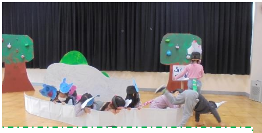
自分たちで作った大道具や小道具

生活発表会では、役になりきって動いたり話したり、4種類の楽器を鳴らしたりして、学級のみなどと一緒に劇遊びや楽器遊びを楽しみました。憧れの年長組に誕生会の司会や当番活動の仕方を教えてもらい、進級に期待を高めています。