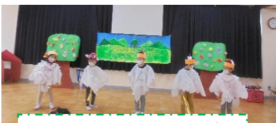
みんなで作り上げた劇