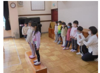
誕生会の司会に挑戦！