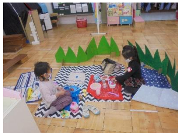
ピクニックごっこ