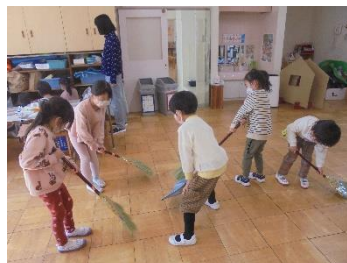
年長組から年中組へ、当番の引継ぎ ← 保育室の掃除