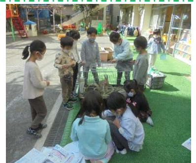
ホームページにも掲載しています