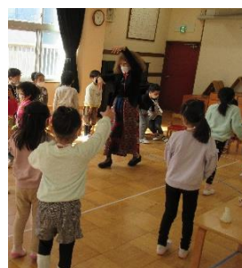
最後の「英語で遊ぼう」