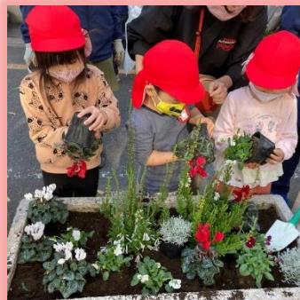
四の橋通児童遊園の花壇の 植付に参加