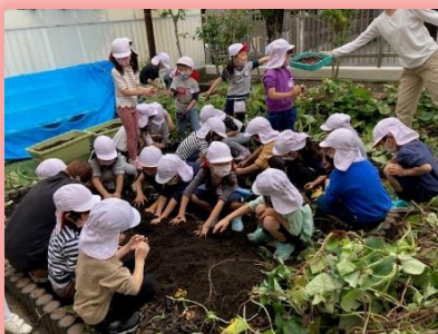
皆で育てたサツマイモの芋掘り

さて、12月の3日(金)、6日(月)に作品展を開催いたします。子どもたちの豊かな発想力、想像力がたくさん詰まって、随所に「やってみよう!」「こうしてみたい!」という気持ちがあふれています。この2日間は幼稚園が、アイデアあふれる三光子ども美術館に大変身します。個人で試したり工夫したりして作り上げた作品、または友達と一緒に取り組み、イメージや考えを互いに伝え合い、合いながら作り上げた作品を、じっくりご覧ください。