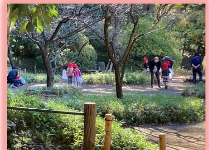
有栖川宮記念公園での散策