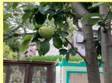
実がなり始めたカリン