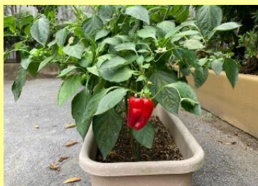
ようやく赤く実ったパプリカ

子どもたちは幼稚園で先生に絵本を読んでもらうのは勿論、大好きですが、それにもましておうちの方が読み聞かせをしてくださる時間は何よりの宝物です。文字が読めるようになって想像力を働かせながら観たり聞いたりする読み聞かせは、小学校3、4年生くらいまではとても重要で、豊かな情操を育みます。それには質の高い絵本を選んであげることが大切で、良い絵本は、文字への興味や関心を高めるだけでなく、本への親しみや美しいものへの感性を磨きます。絵本の読み聞かせを毎日の習慣にして、おうちの方にも絵本の魅力を感じていただき、親子で大いに楽しんでほしいと思います。