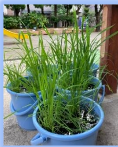
根付いて伸び始めたイネ