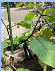
ようやく実ったナス

友達と自分の思いが違うという場面に遭遇した時、子どもたちの心の中で様々な葛藤が生まれます。なんとか問題を解決しようと自分の思いを相手に伝えながら、自分の気持ちに折り合いをつけていくこと、その経験の積み重ねは、友達との関わり方を学ぶことそのものです。自分の気持ちに折り合いをつける方法やその時間の長さは、一人ひとり違います。葛藤しながらも自分の気持ちに折り合いをつけ、より良い方法を見つけてなんとか前に進もうとする。