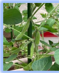
フサフサのエタマメ

集団生活の中でのこのような経験の積み重ねが、幼児一人ひとりの豊かな心の育ちにつながっていきます。