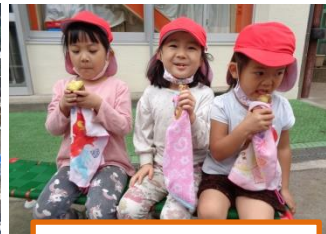
ホクホクでおいしいね!