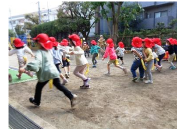
タグとり(年中組) 好きな遊びの中では年少組も時々参加しています。