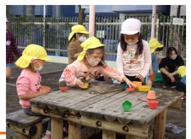
年長さんの砂の型抜きをよく見て真似ています。