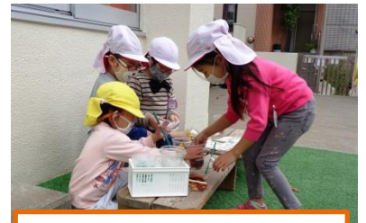
一緒にやる? 教えてあげるね。