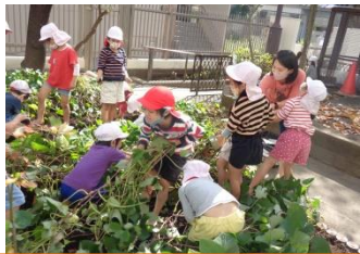
ツルを引っ張って芋を掘ろう!

たき火の煙やにおい、温かさを近くで感じながら、幼稚園の畑で育てたサツマイモをたき火に投げ入れ、焼けるのを楽しみに待ちました。アツアツでホクホクのやきいも、おいしかったね。