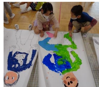
年長組：等身大の自分の絵