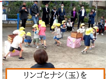
リングとナン(玉)をたくさん拾おう!