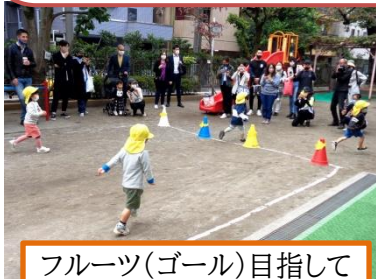
フルーツ(ゴール)目指してよーいどん!