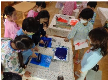
年中組：スチレン版画