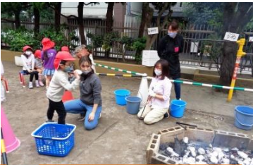
たき火に芋を入れよう!