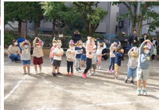
たんぼぼ組のみんながブドウに変身! みんなで踊ると楽しいな。