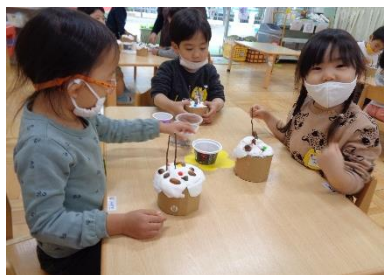
年少組： 紙粘土とドングリのケーキ作り

保護者の皆様には、感染症予防のため行事の縮小や変更等々、通常通りにいかないことに対してご理解・ご協力いただき、温かく見守って下さったことに、教職員一同、感謝申し上げます。来学期もどうぞよろしくお願ひ申し上げます。良い年末・年始をお過ごしください。