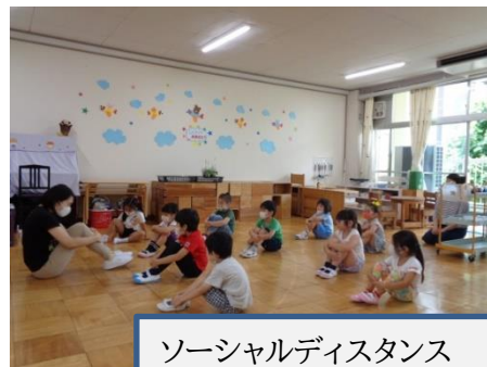
ソーシャルディスタンス

幼稚園で一番大きいお兄さんお姉さんになりました。園生活が再開し、自分たちで生活を進めていこうとする気持ちが高まっています。