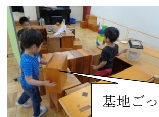
基地ごっこ （持つ・運ぶ・積む）