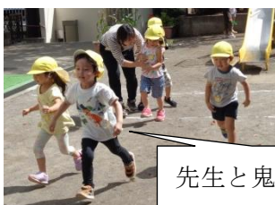
先生と鬼ごっこ （走る・よける）

用具などを操作する動き・・・（持つ・運ぶ・投げる・捕る・転がす・蹴る・積む・掘る・押す・引くなど）