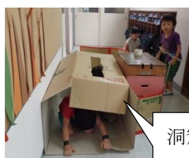
洞窟ごっこ （座る・はう）