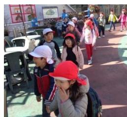
年中組「お別れ遠足」