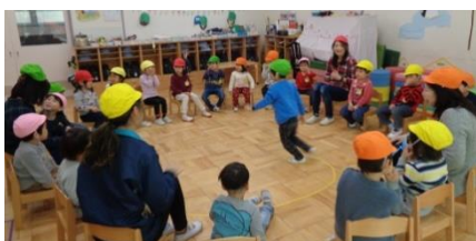
年少組「フルーツバスケット」

保護者の皆様、入園・進級の頃からお子様は、大きく成長しています。振り返って、お子さんの育ちをたくさん発見してください。そして、育ちを支える保育の充実に向け、温かいご支援・ご協力をいただいたことに、心より感謝いたします。ありがとうございました。