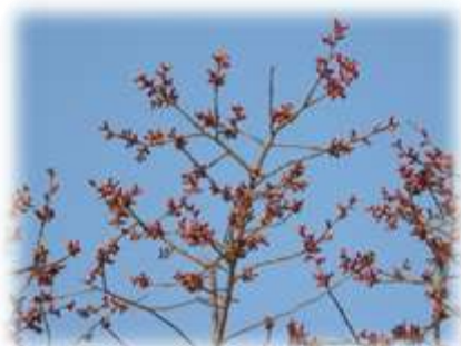
カンヒザクラももうすぐ咲きそうです。