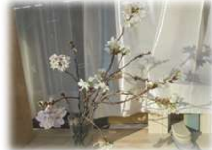
雪で折れた桜も暖かい窓辺で開花しました。