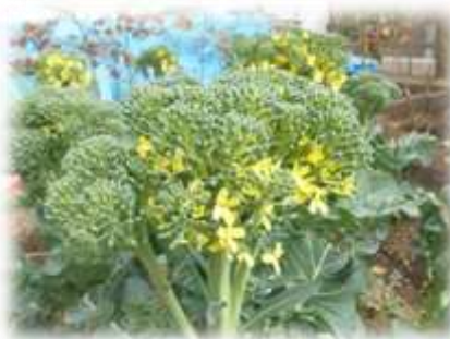
ブロッコリーの花ってかわいいね。