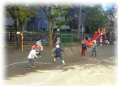
寒さに負けず、元気に鬼遊び