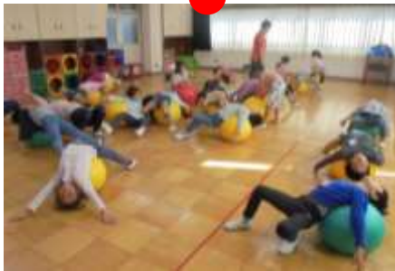
バランスボール体操