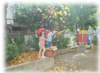
落ち葉の「花火」の打ち上げです