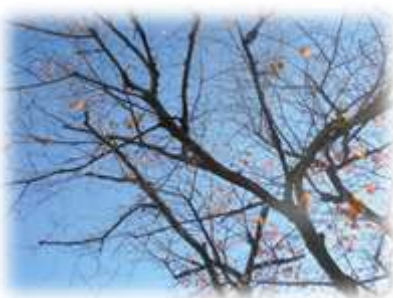
桜の葉っぱもたくさん落ちて……