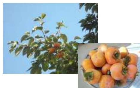
柿もたくさん収穫できました