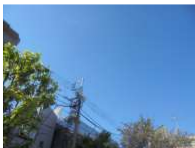
台風一過の雲一つない青空