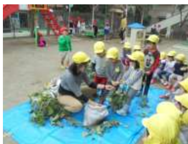
年少組のサツマイモも「うんとこしょ」